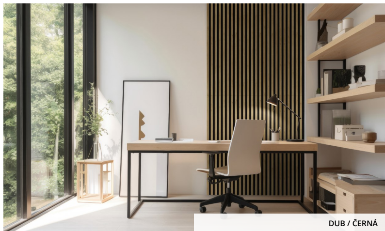
DUB / ČERNÁ