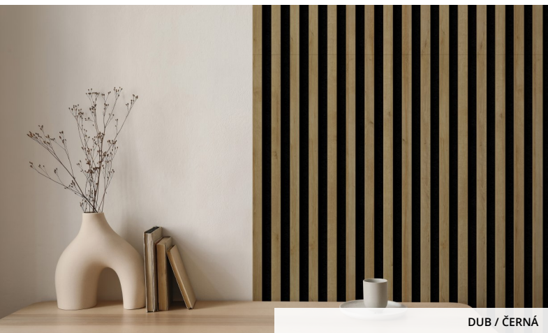
DUB / ČERNÁ