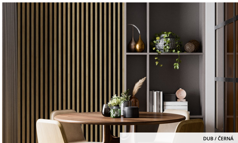
DUB / ČERNÁ