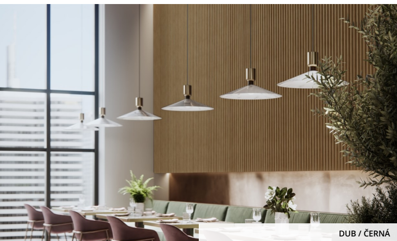
DUB / ČERNÁ