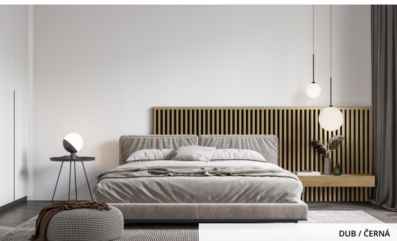
DUB / ČERNÁ