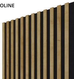
ACOUSTIC PROLINE DUB / ČERNÁ

lamela: MDF + papírová fólie, podklad: filcová plst'