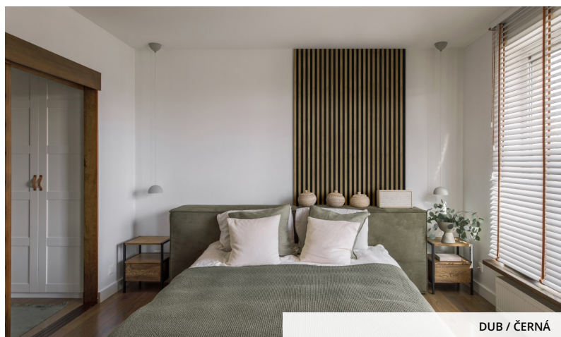
DUB / ČERNÁ